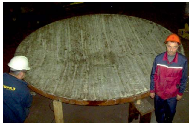
Рис. 2. Крышка шахтной термической печи, футерованная войлоком «мокрым». Компаня «ЕВРАЗ», Колесо-бандажный цех НТМК