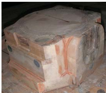
Рис. 2. Модель с применением крепления «ласточкин хвост»

В статье приведены инновации, применяемые при изготовлении форм и моделей методом вакуумно-пленочной формовки.