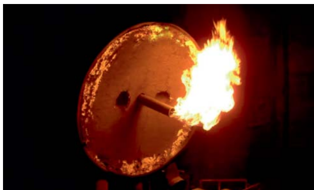
Рис. 5. Крышка стэнда разогрева сталеразливочных ковшей в работе. ОАО «МЕЧЕЛ» – Челябинский металлургический комбинат, ЭСПЦ-6

В декабре 2009 г. ООО «Волокнистые огнеупоры» зафутеровало крышку ВТУ№3 в ЭСПЦ-6 ОАО «ЧМК». В данной футеровке применили «мокрый» войлок мар-