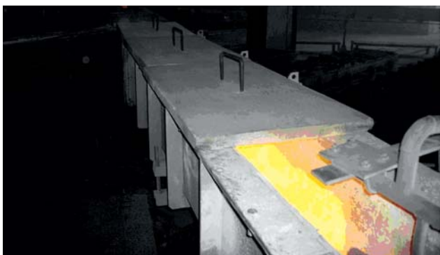
Рис. 3. Крышки желоба для передачи расплава алюминия. ООО «МордовВторСырье», г. Саранск