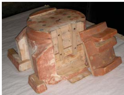
Рис. 1. Модель отливки «Корпус буксы»

Рассмотрим на примере отливки «Корпус буксы», кстати, очень интересный пример в плане получения экономического эффекта из-за больших объемов литья и применяемой устаревшей технологии. Стандартные технологии получения данной отливки подразумевают использование 3-4-х стержней, два из которых формируют, так называемые «челюсти», из-за наличия которых при ВПФ невозможно производить свободный разъем полуформы и модели.