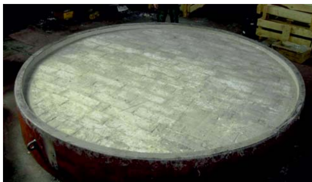
Рис. 4. Футеровка крышки электропечи ОКБ-827. ЗАО «Завод Киров-Энергомаш», Санкт-Петербург

Ранее крышки ОКБ-844 футеровались традиционными шамотными материалами марки ША. Масса футеровки составляла более 6 т. Масса футеровки крышки печи ОКБ-827, выполненной из керамоволокнистого «мокрого» войлока марки ВР-300 с последующей сушкой в течение 7 дней, составляет 910 кг.